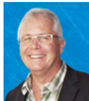
Der Präsident von HIOB International Beat Iseli (BI)

Ihnen, liebe Leserin, lieber Leser, danke ich ganz herzlich für Ihre Unterstützung und Ihr Wohlwollen. Ich wünsche Ihnen Gottes reichen Segen und B'hüet nech Gott.