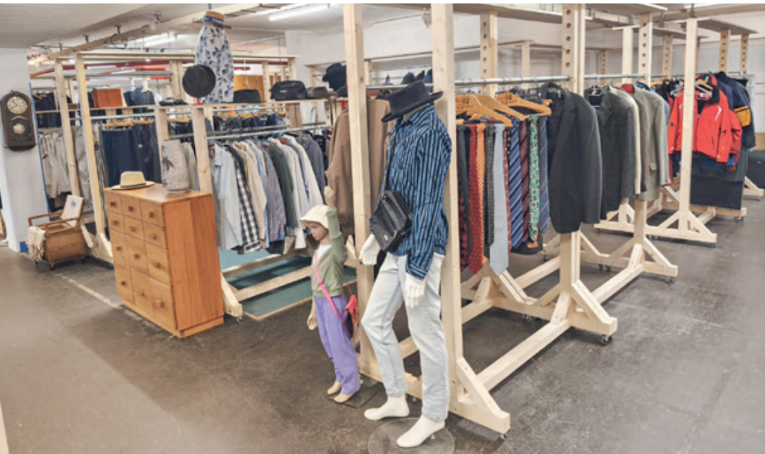
Unten: Die neue Kleiderabteilung in Bümpliz